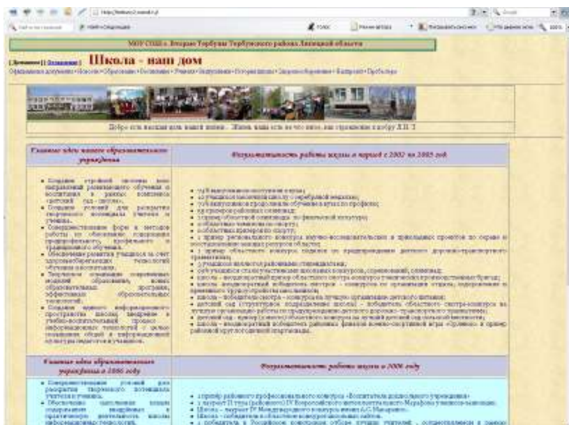
Главная страница школьного сайта

популяризацию и поддержку лучших Интернет-ресурсов, развитие творческих способностей школьников. Создатели нашего школьного сайта, лучше других раскрыв Интернет-ресурс школы и результаты образовательного процесса, стали победителями в престижной номинации «Образование для будущего». Их работа была отмечена Дипломом; спонсор конкурса Липецкий филиал «Центр-телеком» подарил школе современный широкополосный модем и многочисленные сувениры.