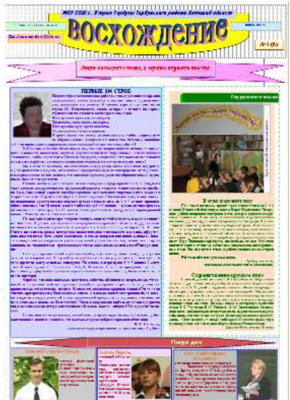
Первая страница одного из номеров газеты «Восхождение»

В 1996 году в районе впервые прошёл профес-