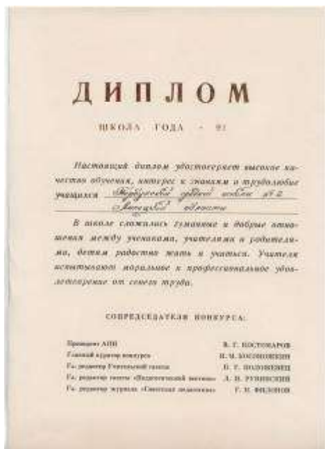
Диплом «Школа года – 91»

Необходима поддержка районного Совета в решении ряда вопросов по преобразованию средней общеобразовательной школы в учреждение нового типа: «Детский сад – школа».