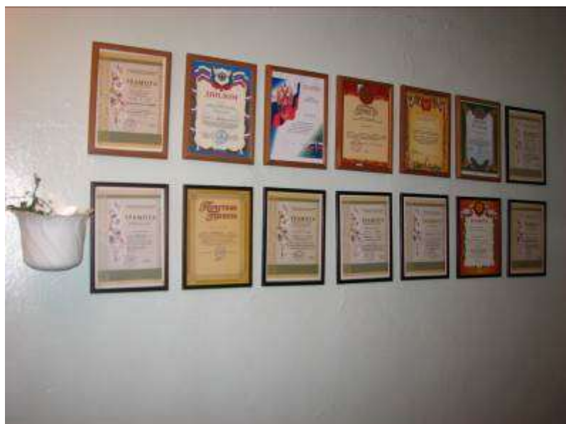
Грамоты за спортивные командные победы