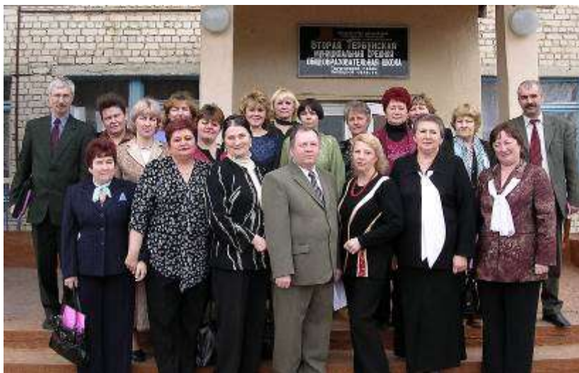
Участники областного семинара «Построение учебного сообщества младших школьников»

Вторая Тербунская средняя школа в рамках республиканского эксперимента первая в районе перешла к профильному обучению на старшей ступени школы. Это новшество было