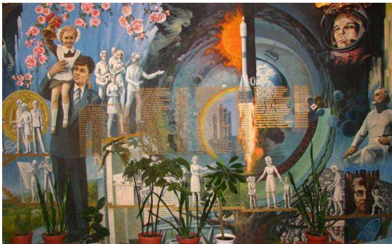
Панно с именами медалистов школы

Однако учащиеся по-прежнему стремятся к знаниям. Не сокращается число выпускников, заканчивающих школу с золотой и серебряной медалями. Медалисты – гордость школы. Их имена написаны золотыми буквами на панно в рекреации здания школы, которое выполнено бывшим учителем школы Межевым А.А.