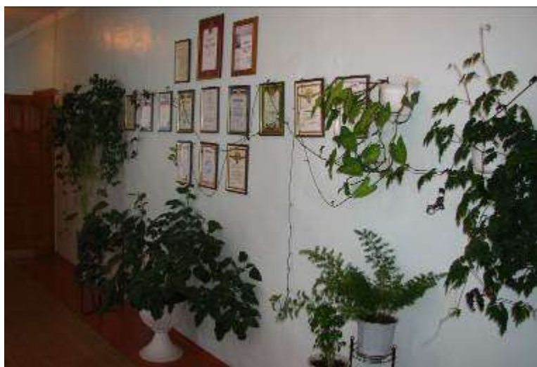
Достижения педагогического коллектива отражены в многочисленных грамотах и дипломах