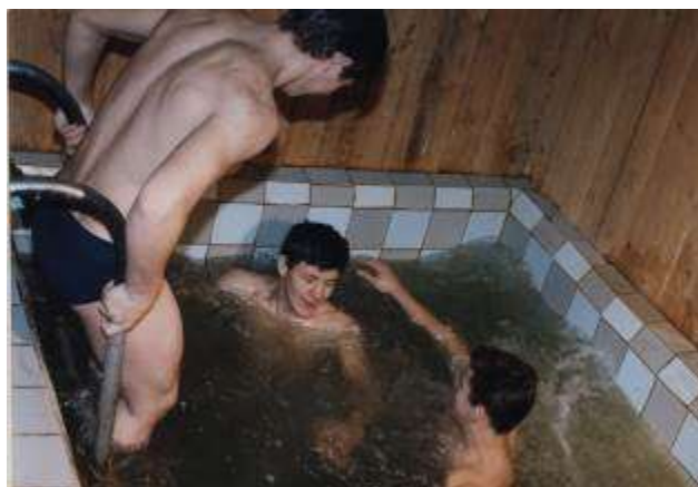
После занятий в спортивной секции

В 1990 году на месте запущенных раздевалок работники школы и юноши выпускного класса оборудовали сауну с бассейном. Много лет сауна пользовалась спросом у работников школы, учителей-пенсионеров, старшеклассников и выпускников школы. Летом она используется для заготовки сухофруктов.