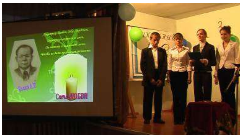
На вечере, посвящённом Дню учителя

Вся внеурочная деятельность учащихся направляется президентским клубом, заседания которого проводятся еженедельно по пятницам. Подводятся итоги недели, намечаются дела на следующую неделю, оценивается дежурство по школе. Вся эта информация в понедельник выносится на рабочую общешкольную линейку. С 2003 года системой ученического самоуправления используется новая форма работы: дни ученического самоуправления, которые проводятся раз в учебную четверть. В этот день каждый класс проводит определённую работу.