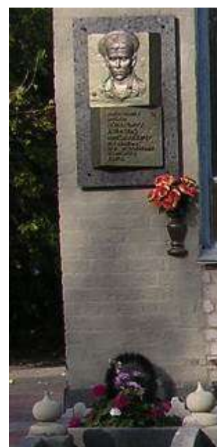
Доска памяти Понарына Алексея

Психолого-педагогическая, социальная службы школы позволили вести целенаправленную работу по изучению психологиче-