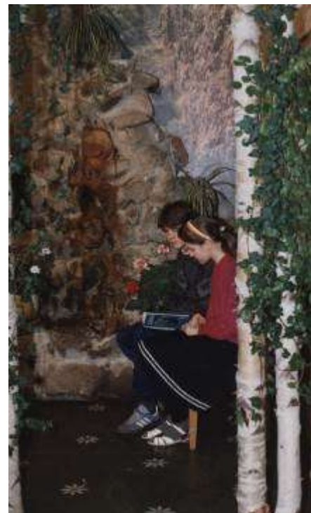
Учащиеся отдыхают у водопада в естественно-научном кабинете

Оборудовано овощехранилище на 50 тонн, что позволяет до весны хранить в свежем виде картофель и овощи. Школа располагает набором сельскохозяйственной техники (тракторы МТЗ-82, ДТ-75, картофелесажалка, картофелекопалка, автомобиль ЗИЛ, прицепной инвентарь). Все это позволяет выращивать на площади 5 га и обеспечивать в достаточном количестве бесплатно школьную и детсадовскую столовые картофелем и овощами.