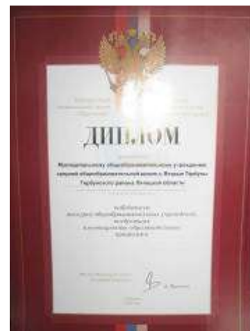
Диплом школы-победителя в ПНП «Образование»