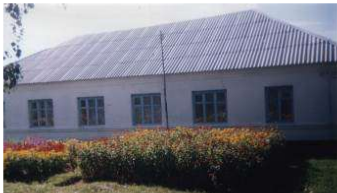
Здание детского сада

В 1994 году детский сад закрыли из-за аварийного состояния.