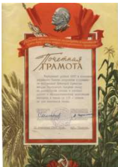
Почётная грамота Школа награждена в связи со 125 – летием со дня её основания.

Под его руководством в школе создан хороший музей В.И. Ленина. Открытие прошло 22 апреля 1965 года и было посвящено 95-летию со дня рождения Ленина.