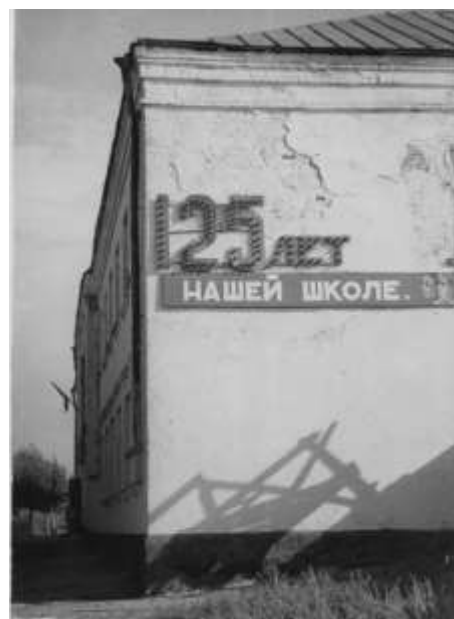
Празднично оформленное здание школы. 1968 год

В 1968 году Вторая Тербунская средняя школа отмечала свое 125-летие. Тербунский РК КПСС и исполком районного Совета трудящихся наградил Почетной грамотой коллектив школы за достигнутые успехи в учебной работе и коммунистическое воспитание молодежи в связи с юбилеем. Была разработана большая праздничная программа. Состоялся концерт, подготовленный учащимися. К этому событию здание школы было украшено иллюминацией.