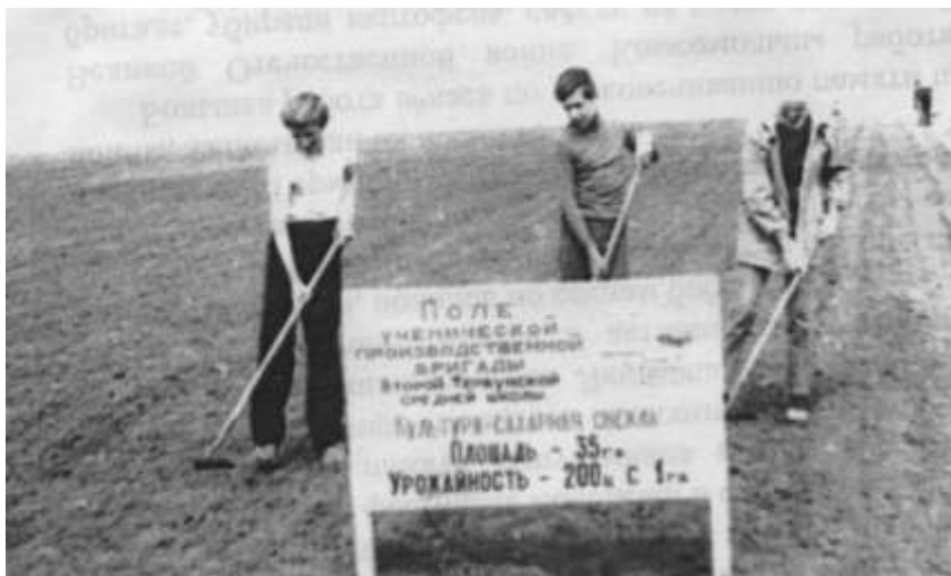
Ученическая производственная бригада на прополке свёклы. 1984 год