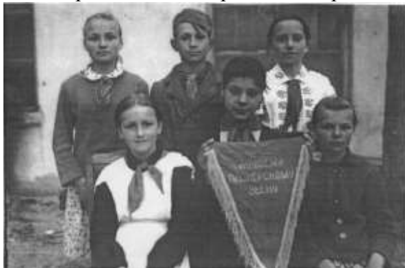
Лучшему пионерскому отряду вручен переходящий вымпел

В школе придавалось большое значение развитию пионерского движения. Именно с этого возраста начинали растить активистов, достойную смену комсомолу. Использовались различные формы работы: пионерские сборы, тимуровское движение, поисковая деятельность, сборы металлолома, макулатуры, лекарственных трав. Пионерская дружина имени майора Г.А. Нафикова на протяжении многих лет была правофланговой. Звонкое пионерское детство обеспечивали замечательно работавшие старшие пионерские вожатые.