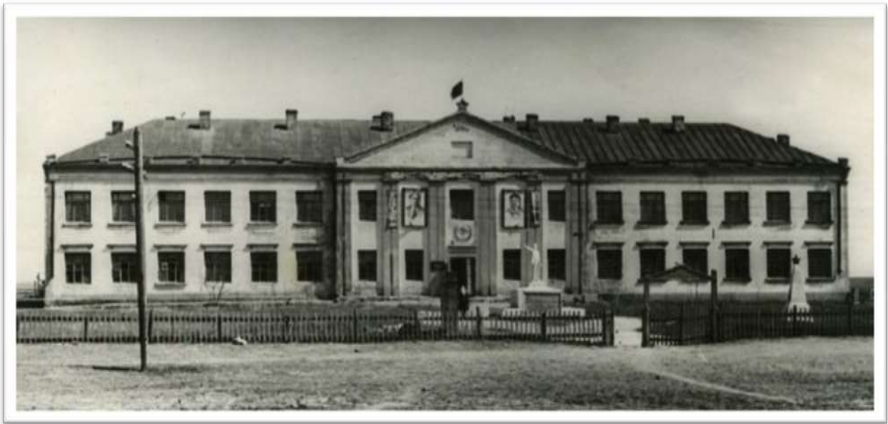
Здание райкома партии, построенное в 1939 году. В 50-х годах в нём находилась школа. Здание не сохранилось.