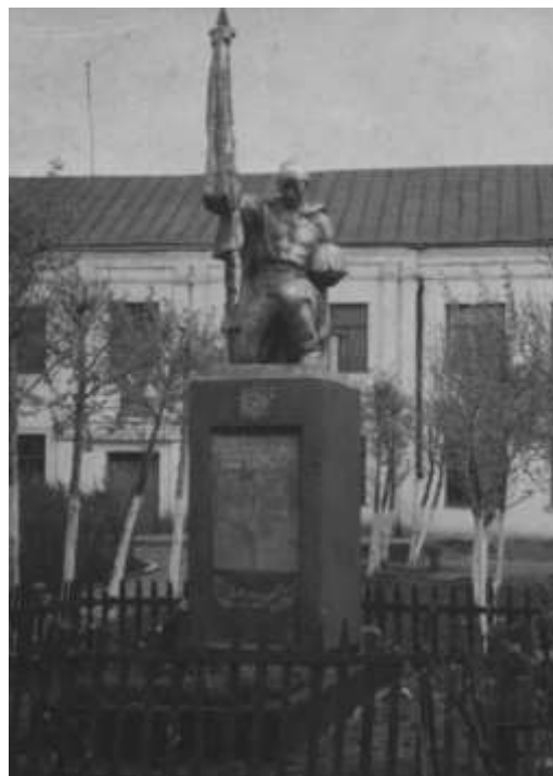
Памятник погибшим воинам. Установлен в 1961 году напротив школы

8 мая 1959 года в эту могилу был перенесен прах еще шести воинов Советской Армии. Со 2 по 11 мая 1961 года проведены работы по замене обелиска. 9 мая 1961 года установлено скульптурное изображение коленапреклоненного воина.