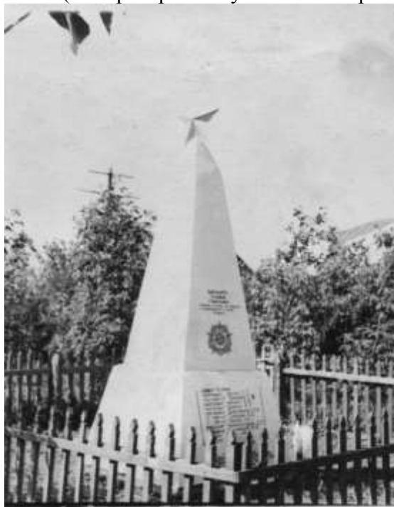
Первый вариант памятника погибшим воинам у здания райисполкома

Представляет интерес история появления братской могилы напротив райисполкома, а затем школы. До 1949 года в селе находились отдельные могилы (одиночные, малогрупповые) воинов, погибших при защите Вторых Тербунов в годы Великой Отечественной войны. В 1949-1950 годы шло перезахоронение останков воинов в братскую могилу, которую расположили напротив здания райисполкома. На месте захоронения был установлен каменный памятник (четырёхгранная усеченная пирамида).