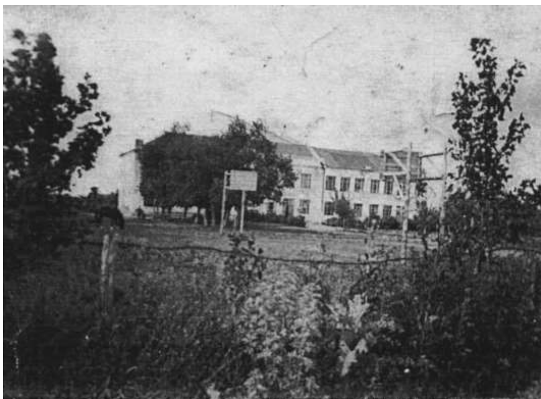
Здание средней школы в 50-е годы (бывшее здание райисполкома)

С 1 сентября 1956 года школа перешла в двухэтажное здание бывшего райисполкома, в котором она находилась до 1973 года. (Два последующих года, когда шло строительство современного здания школы, занятия велись в будущем здании сельского совета). Здание с трудом вмещало увеличившееся число учеников, однако в нем было одно для того времени достоинство – водяное отопление. Старожилы села вспоминают, что здание для райисполкома было построено из кирпича разрушенных церквей сел Вторые Тербуны и Яковлево; а для устройства ступенек двух лестниц пошли доски церковных икон, на которых много раз закрашивались просматриваемые лики святых.