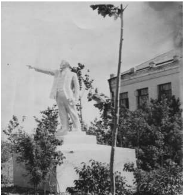
Памятник В.И. Ленину у здания райисполкома

В 1949 году по решению райкома партии у здания, в которое перешла школа, был установлен памятник В.И. Ленину, воздвигнутый в 1935 году с. Большая Поляна, бывшем центре Большеполянского района. 26 мая 1959 года памятник перенесен к зданию Дома культуры. В 1982 году он был снесен из-за низкого художественного качества.