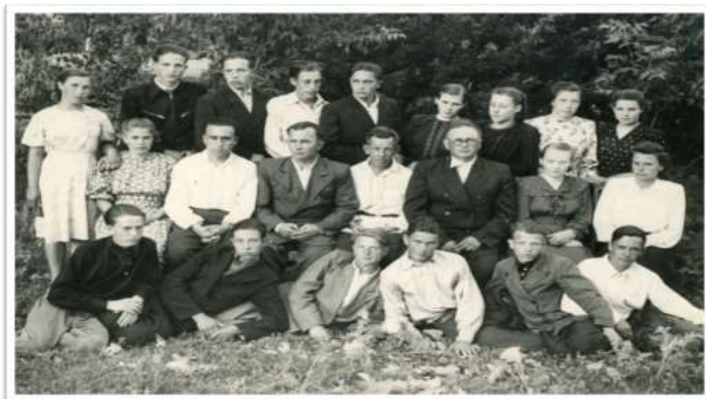
Выпуск 1953 года, 10А класс.