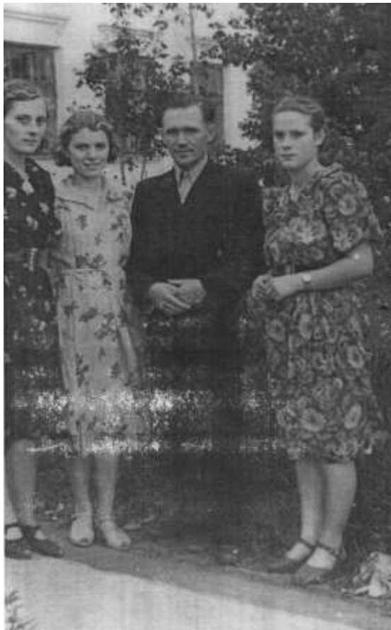
Встреча со строителями Беловской ГРЭС (1957 год)